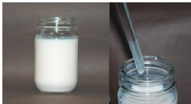
外観均一 凝集物なし